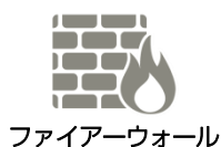
ファイアーウォール

ファイアーウォール、VPN、IPS、アンチウイルスなど、数多くあるセキュリティの機能ごとに対策するのは大変だし、予算も限られている。