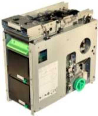
F53 El dispensador de billetes

Alto Rendimiento Múltiple Casete Dispensador