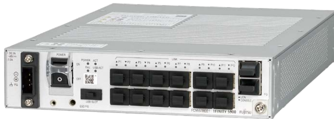
1FINITY S900 DC電源タイプ