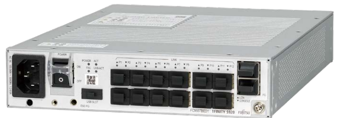
1FINITY S920 AC電源タイプ