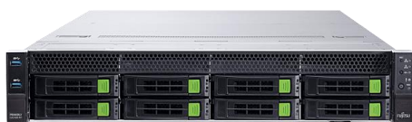
Zinraiディープラーニング システム 200M (A30/A100搭載)

Zinraiディープラーニング システムは、ディープラーニングによるデータ利活用をスピーディーにかつスムーズに実現し、お客様のデジタルトランスフォーメーションの加速をご支援します。