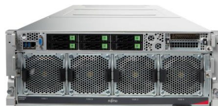
Zinraiディープラーニング システム 210H (HGX A100搭載)