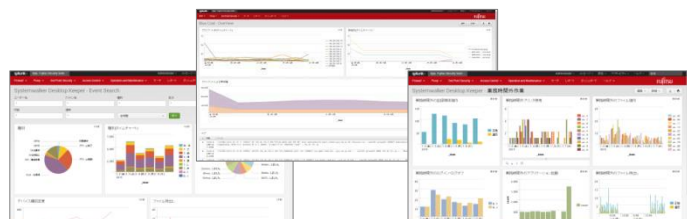
これまでの構築実績・ノウハウをもとに 独自に開発したダッシュボード（ご提供可能）

富士通は国内ファーストユーザとして、社内実践で培った多数のノウハウをお客様へ還元しています