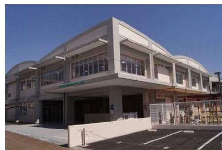
写真：日野市発達・教育支援センター「エール」

「発達・教育支援システム」は、現在、幼児期の子育て支援機関として公立の幼稚園・保育園と接続されていますが、2017（平成29）年度には、民間保育園と幼稚園との接続を予定しており、市内未就学児が在園する各施設の日常における幼児教育や保育をサポートしていかれます。