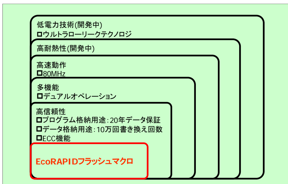
図 2. フラッシュメモリ テクノロジーマップ

EcoRAPIDをエコロジー技術の中核として展開していく予定です(図2. フラッシュメモリ テクノロジーマップ)。これらのエコロジー技術を搭載したフラッシュマイコンを提供することで、車載市場での要求に強い高信頼性、高温対応、高速動作を実現し、組み込みシステムの環境負荷低減に貢献してまいります。