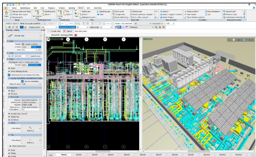
CADEWA Smart V2.0 English Edition 画面イメージ

新バージョンの「CADEWA Smart V2.0 English Edition」ではBIMへの対応や品質向上に寄与する『かしこさ』を強化いたしました。今後も更なる機能強化を進め、建設業の課題解決に向け全力で取り組んでまいります。