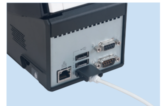
コネクタカバー (USBケーブル抜け防止)