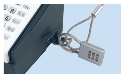
盗難防止ワイヤーは付属しません。