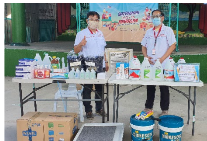
参加スタッフと寄付品