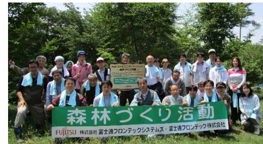
活動時の記念撮影

FJFSが、令和3年度 群馬県環境賞顕彰「環境功績賞」を受賞しました。同社では、環境保全活動の一環として2008年より「地域貢献美化活動ボランティア」を実施しており、地域と連携した森林整備活動を実践し、森林環境の保全に寄与したことが評価されました。