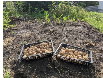
事例①：完全無農薬野菜の再生産

2021年度は、「従業員のSDGs貢献事例の募集」イベントを社内イントラネット上で実施し多くの従業員から貢献事例の投稿がありました。具体的には、「自宅での太陽光発電」、「完全無農薬野菜の再生産」、「国連難民サポーター」などの模範的な事例が多く、社内のSDGs活動の活性化につながっています。