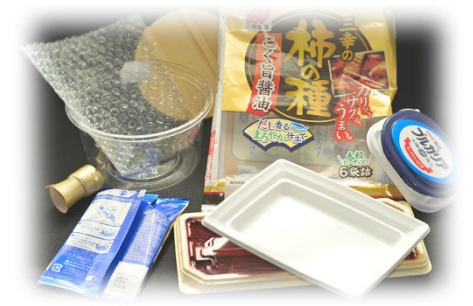
事例②：家庭でのプラごみ分別