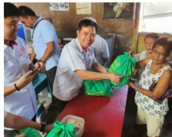
クリスマスプレゼント