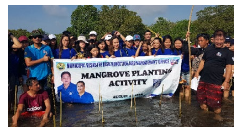
活動後の記念撮影