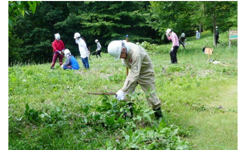
手鎌による草刈り