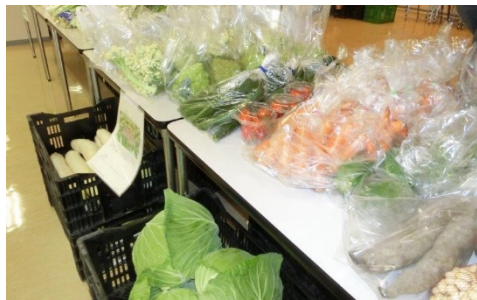
販売会における野菜の陳列