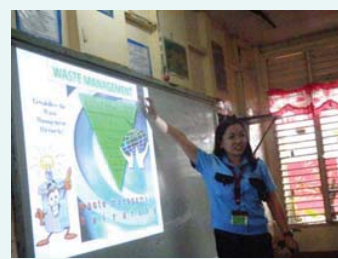
小学校(ラグナ州ピナン)で講義する社員

ラグナ州ピナンにある小学校を訪問し、小学生たちへ地球環境問題を中心に環境出前授業を行いました。 生徒たちは、授業に対して真剣な眼差しで聞き入っていました。 (2013年10月1日)