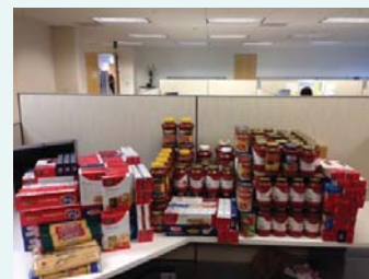
社員によって集められたスパゲティ

社員の寄付で購入したスパゲティとソースをザ・カテリーナ・クラブへ提供しました。 ザ・カテリーナ・クラブは、約1,000人の恵まれない子供たちへ栄養的にバランスのとれたパスタや野菜の食事を週7回提供しています。 (2014年3月)