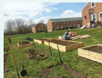
苗床設置（市民農園）

ニューヨーク州ブラッツバーグの市民農園にて、新しい苗床を設置して市民農園の拡大を支援しました。 活動の結果、新たに12個の苗床を設置することができました。 (2014年5月10日)