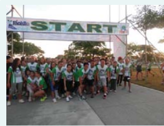
チャリティーマラソン(ラグナ州)

ラグナ州サンタロサで行われたチャリティー・マラソンに参加し、30,000フィリピンペソを寄付しました。 同日、アヤラ・ランドで行われた植樹活動にも参加し、500本の苗木を植えました。 (2014年4月27日)