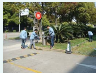
金橋リペア工場周辺

2012年度下期から継続して、四半期に1回、金橋リペア工場周辺の清掃活動を行っています。 これからも、地域の美化を積極的に推進していきます。 (2014年6月6日)