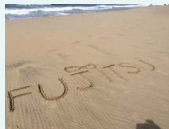
ハンティングトンビーチ

カリフォルニア州オレンジ郡のコースト・キーパー(海岸管理者)と共にハンティングトンビーチにおける清掃活動を実施しました。 活動の結果、地域の人たちが海岸を安心して利用できるようになりました。 (2014年4月12日)