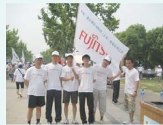
世紀公園でのボランティア

2009年度から、毎年、上海市組合主催のランニング・ボランティアに参加しています。 当イベントは、上海市の貧しい子供への生活・教育用品の提供を行っています。 2013年末までに40名の社員が参加。累計約20万円を寄付しました。 (2014年5月11日)