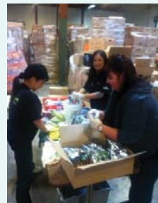
食糧の小分け・袋詰め

オレンジ郡(カリフォルニア州)のセカンドハーベスト・フードバンクが主催する、フットヒルランチ事業所周辺の貧しい世帯へ食糧を提供する活動に参加しました。 社員50名が参加し、154ポンドの食料を寄付しました。 (2013年10月)