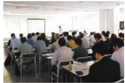
第6期環境行動計画説明会の様子

2つの取り組みについては、取り組みテーマごとに3段階のステージ(I～III)を設定しており、社会動向、お取引先の状況などを踏まえご協力をお願いしてまいります。