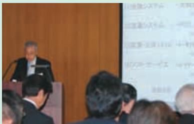
事業方針説明の様子

また、お取引先の皆様方に新潟工場内を案内し、CMSへの取り組み状況などを、ご覧いただきました。