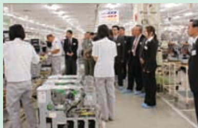
新潟工場案内の様子