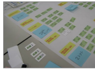
【実際の業務名・担当要員名を使い、シミュレーション】