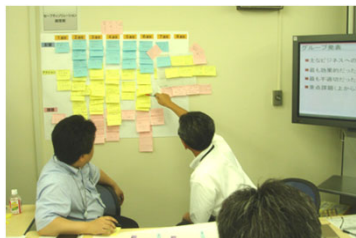
【時系列に影響・アクション・課題を整理】