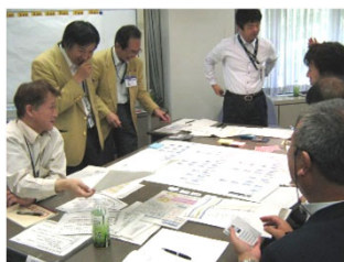
【欠勤シミュレーションに基づき、要員再配置計画を検討】

高病原性新型インフルエンザ等感染症発生時に想定される社会状況や従業員が大幅に欠勤する状況を疑似体験し、いかに自社の重要業務を継続するか、また、そのための事前対策や課題を検討していただきます。BCM訓練センターが独自に開発したシミュレーション・ツールを活用することで、実際の業務名・従業員名を用いて、要員が次々と欠勤し切迫する状況を、よりリアルにご体感いただくことが可能です。