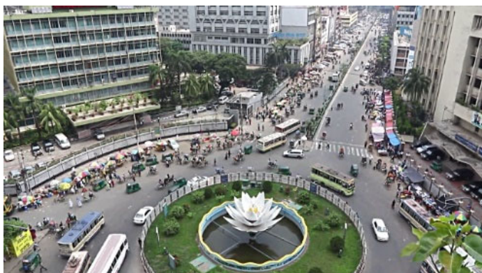
ダッカビジネス街