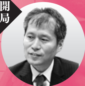
たか お しんじ 高尾 紳路 九段(日本棋院)

東京都出身、21歳。 令和2年に第45期新人王戦優勝。令和3年には第47期天元戦で一力遼を破り、入段から七大タイトル獲得の最短記録かつ史上最年少で天元位を獲得。