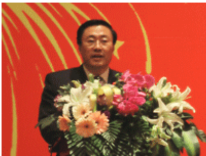
大连高新技术园区主任栾先生