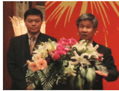
SEC 董事长徐先生和本公司社长兼子先生