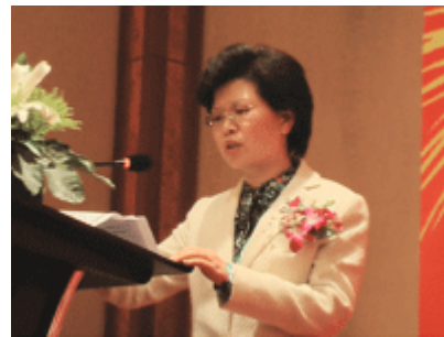
大连市副市长朱女士