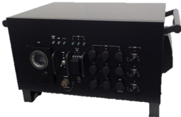
PRIMETUNE5000 サーバ本体 FC7960A01