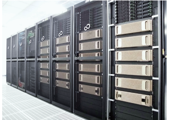
RAIDEN (Riken Alp Deep learning ENvironment)

またAI研究の進歩は非常に早いいため、現行のシステムも数年後は刷新の必要があるかもしれません。AIPセンターは、富士通ならそうした変化にも的確に対応できるものと期待しています。