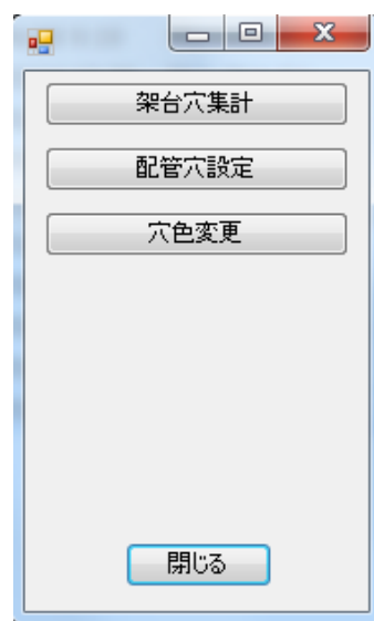
穴ツールメニュー画面