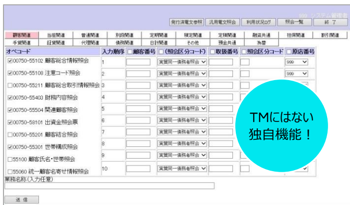
照会処理画面(イメージ)

照会したい複数のオペコードの選択、複数の顧客番号等の項目を入力して、一括照会処理を行います。