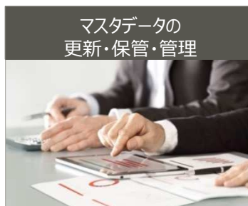
マスタデータの更新・保管・管理

▶ マスタデータをインストールしたHDD/SSDを用いて交換を行うため、再インストール等の作業なしに業務が再開できます。