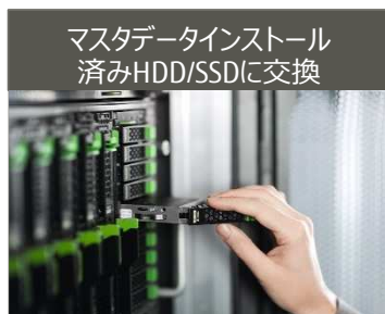
マスタデータインストール済みHDD/SSDに交換

▶ マスタデータをインストールしたHDD/SSDを用いて交換を行うため、再インストール等の作業なしに業務が再開できます。