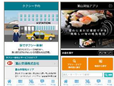
タクシー予約アプリ