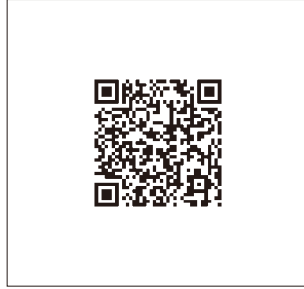
P2 ■ ネットワーク ソリューションパンフレット