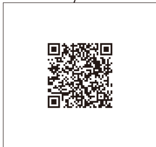
P68 ■ Catalystシリーズ