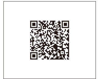
P103 ■ リアルタイム映像伝送装置 P105 ■ 映像収集・蓄積・ 配信ソフトウェア