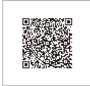
P12 ■ CFX2000