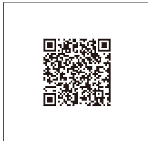
P117 ■ SupportDesk (ネットワーク関連)