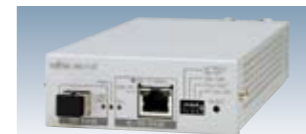
AN-110 -10~55°C AC