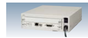
LC-110BA (ボックスタイプ (AC)) AC LC-110BD (ボックスタイプ (DC)) DC ※写真は AC 電源タイプ -10~55°C