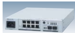
AN-100 -10~55°C AC