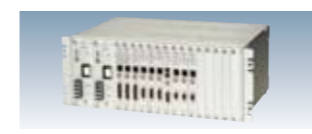
LC-130R (ラックタイプ) -10~55°C 電2 AC・DC