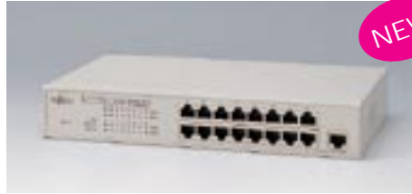
LH1216C デュアルスピードハブ

【型名】：LH1208C 標準価格：¥39,300 備考：10/100BASE-TX×8デュアルスピード対応 LH1208C/1216Cと合わせ、最大4台までスタック可能 19インチラック取付金具添付