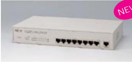
LH1208C デュアルスピードハブ

【型名】：LH1208C 標準価格：¥39,300 備考：10/100BASE-TX×8デュアルスピード対応 LH1208C/1216Cと合わせ、最大4台までスタック可能 19インチラック取付金具添付