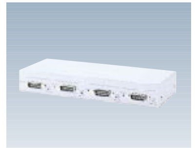
F9190F42 マルチトランシーバ 【型名：F9190F42】 標準価格：¥58,000 10BASE5(AUI)×4 245×113×36.5mm / 0.75kg 1.3W / 4.6KJ/h 備考：機器4台を10BASE2幹線へ接続