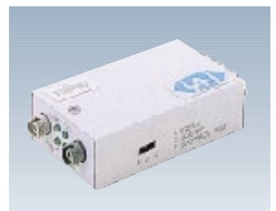
F9190RT1 リモートトランシーバ 【型名：F9190RT1】 標準価格：¥80,000 10BASE5(AUI)×1 光ケーブル(GI、短波、FCコネクタ)×1 43×83.5×21mm / 0.1kg 0.8W / 2.9KJ/h 備考：10BASE5 / 2間を光ケーブルで接続