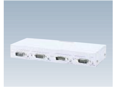
F9190E42 マルチトランシーバ 【型名：F9190E42】 標準価格：¥58,000 10BASE5(AUI)×4 243×113×36.5mm / 0.76kg 1.3W / 4.6KJ/h 備考：機器4台を10BASE5幹線へ接続