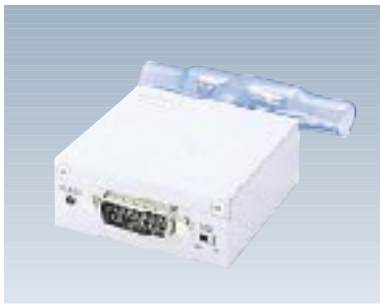
F9190F12 トランシーバ 【型名：F9190F12】 標準価格：¥19,000 10BASE5(AUI)×1 65×75×25mm / 0.2kg 0.8W / 2.9KJ/h 備考：機器1台を10BASE2幹線へ接続