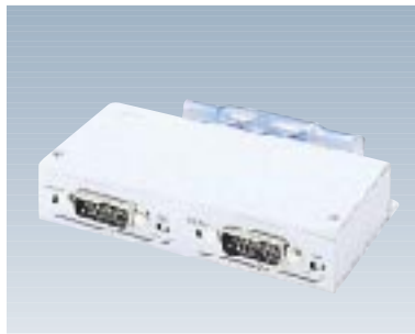
F9190F22 マルチトランシーバ 【型名：F9190F22】 標準価格：¥35,000 10BASE5(AUI)×2 130×80×25mm / 0.31kg 1.0W / 3.8KJ/h 備考：機器2台を10BASE2幹線へ接続