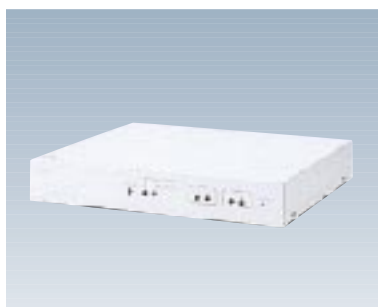
F9190R23 レピータ 【型名：F9190R23】 標準価格：¥80,000 10BASE5(AUI)×2 250×200×45mm / 2.1kg 14.2W / 47.3KJ/h 備考：10BASE5 / 2間を相互接続し延長する装置