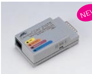
LFA-R0535 トランシーバ 【型名：LFA-R0535】 標準価格：¥8,800 10BASE5(AUI)×1、10BASE-T×1 43×78×23mm / 0.06kg 2.5W / 9KJ/h 備考：AUI機器をハブに接続する時に使用 [ファミリハード製品]