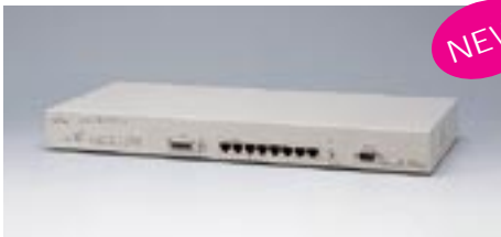
LH1208VCA エージェントハブ

【型名】：LH1208VCA 標準価格：¥97,500 備考：10/100BASE-TX×8、AUIポート×1 SNMPエージェント機能、デュアルスピード対応 LH1208VCA/1216VCAと合わせ、最大4台までスタック可能 19インチラック取付金具添付