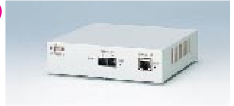
F9190RT3 リモートトランシーバ

【型名】：F9190RT3 標準価格：¥198,000 備考：100BASE-TXと100BASE-FXを交換