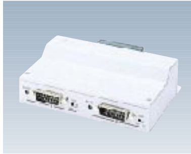
F9190E22 マルチトランシーバ 【型名：F9190E22】 標準価格：¥35,000 10BASE5(AUI)×2 130×95×36mm / 0.4kg 1.0W / 3.8KJ/h 備考：機器2台を10BASE5幹線へ接続