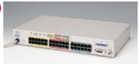
LH36XA エージェントハブ

【型名】：LH36XA 標準価格：¥300,000 備考：10BASE-T×36、AUI、BNC、SNMPエージェント機能