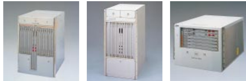
GeoStream R980 ・スイッチング容量160Gbps ・インターフェーススロット:14 GeoStream R940 ・スイッチング容量40Gbps ・インターフェーススロット:8 GeoStream R920 ・スイッチング容量20Gbps ・インターフェーススロット:4