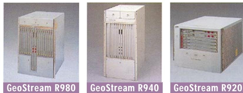
GeoStream R980: スイッチング容量160Gbps, インタフェーススロット:14 GeoStream R940: スイッチング容量40Gbps, インタフェーススロット:8 GeoStream R920: スイッチング容量20Gbps, インタフェーススロット:4