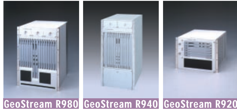
GeoStream R980: スイッチング容量160Gbps, インタフェーススロット:14 GeoStream R940: スイッチング容量40Gbps, インタフェーススロット:8 GeoStream R920: スイッチング容量20Gbps, インタフェーススロット:4