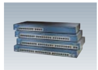
Catalyst 3550-12T 10 / 100 / 1000BASE-T対応 レイヤ3スイッチ