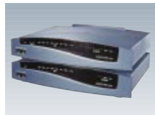
CISCO811 / 813シリーズ 小規模事業所向けに最適なイントラネット、インターネットアクセスリモートルータ