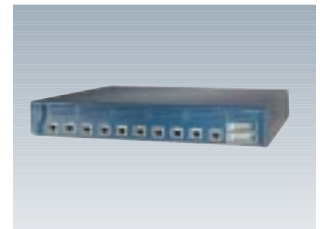
Catalyst 2950シリーズ 高機能BOX型スイッチングハブ