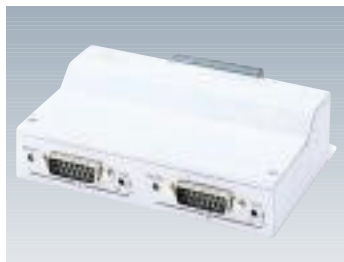
F9190E22 マルチトランシーバ 【型名: F9190E22】 標準価格: ¥35,000 10BASE5(AUI)×2 130×95×36mm / 0.4kg 1.0W / 3.8KJ/h 備考: 機器2台を10BASE5幹線へ接続