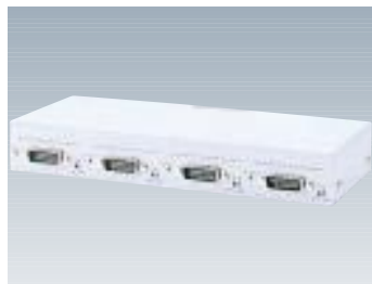
F9190E42 マルチトランシーバ 【型名: F9190E42】 標準価格: ¥58,000 10BASE5(AUI)×4 243×113×36.5mm / 0.76kg 1.3W / 4.6KJ/h 備考: 機器4台を10BASE5幹線へ接続