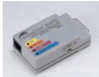
LFA-R0535 トランシーバ 【型名: LFA-R0535】 標準価格: ¥8,800 10BASE5(AUI)×1, 10BASE-T×1 43×78×23mm / 0.06kg 2.5W / 9KJ/h 備考: AUI機器をハブに接続する時に使用 [ファミリーハード製品]