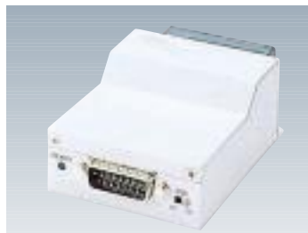
F9190E12 トランシーバ 【型名: F9190E12】 標準価格: ¥19,000 10BASE5(AUI)×1 65×90×36mm / 0.27kg 0.8W / 2.9KJ/h 備考: 機器1台を10BASE5幹線へ接続