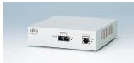
F9190RT3 リモートトランシーバ