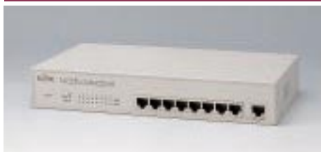
LH1208C デュアルスピードハブ