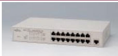
LH1216C デュアルスピードハブ

備考: 10/100BASE-TX×8デュアルスピード対応 LH1208C / 1216Cと合わせ、最大4台までスタック可能 19インチラック取付金具添付(EIA規格準拠)