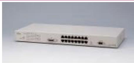
LH1216VCA エージェントハブ

備考: 10/100BASE-TX×8, AUIポート×1 SNMPエージェント機能、デュアルスピード対応 NetEyemanager / LANによる詳細管理 LH1208VCA / 1216VCAと合わせ、最大4台までスタック可能 19インチラック取付金具添付(EIA規格準拠)