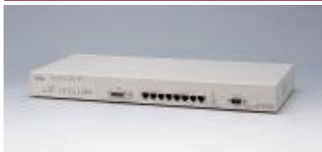
LH1208VCA エージェントハブ