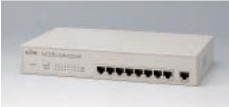
LH1208C デュアルスピードハブ