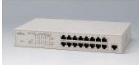
LH1216C デュアルスピードハブ

備考: 10/100BASE-TX×8デュアルスピード対応 LH1208C / 1216Cと合わせ、最大4台までスタック可能 19インチラック取付金具添付(EIA規格準拠)