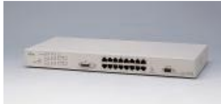
LH1216VCA エージェントハブ

備考: 10/100BASE-TX×8, AUIポート×1 SNMPエージェント機能、デュアルスピード対応 NetEyemanager / LANIによる詳細管理 LH1208VCA / 1216VCAと合わせ、最大4台までスタック可能 19インチラック取付金具添付(EIA規格準拠)