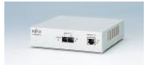
F9190RT3 リモートトランシーバ