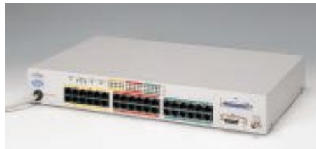
LH36XA エージェントハブ