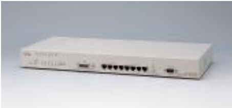
LH1208VCA エージェントハブ

備考: 10/100BASE-TX×16デュアルスピード対応 LH1208C / 1216Cと合わせ、最大4台までスタック可能 19インチラック取付金具添付(EIA規格準拠)