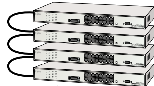
スタック接続ではカスケード段数制限による影響を受けることなく増設が可能