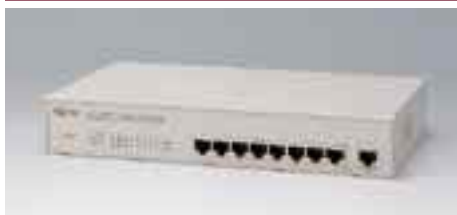
LH1208C デュアルスピードハブ