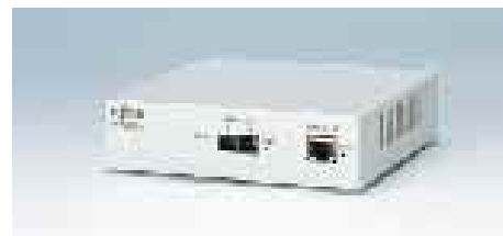
F9190RT3 リモートトランシーバ