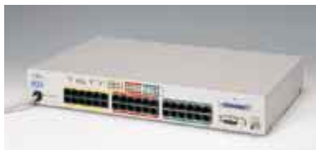
LH36XA エージェントハブ