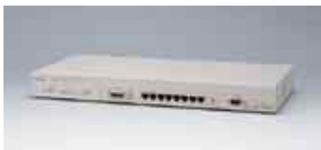
LH1208VCA エージェントハブ

備考：10/100BASE-TX×16デュアルスピード対応 LH1208C / 1216Cと合わせ、最大4台までスタック可能