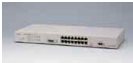
LH1216VCA エージェントハブ

備考：10/100BASE-TX×8、AUIポート×1 SNMPエージェント機能、デュアルスピード対応 NetEyemanager / LANによる詳細管理 LH1208VCA / 1216VCAと合わせ、最大4台までスタック可能