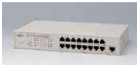
LH1216C デュアルスピードハブ

備考：10/100BASE-TX×8デュアルスピード対応 LH1208C / 1216Cと合わせ、最大4台までスタック可能