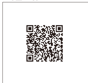
P29 ■ IPCOM