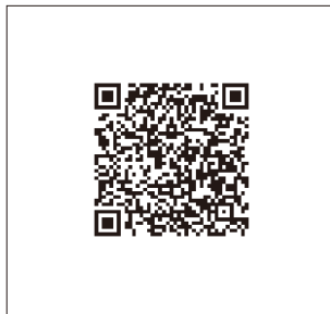
P111■ SupportDesk (ネットワーク関連)