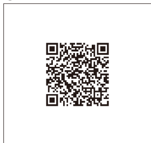
P26 ■ Cisco ASRシリーズ、 ISRシリーズ