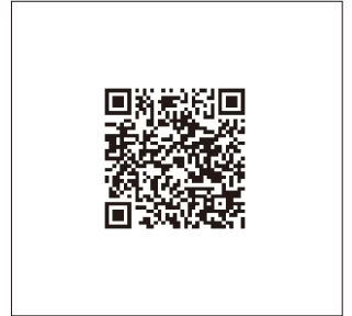
P43 ■ FireEyeシリーズ P44 ■ FireEye セキュリティ運用サービス