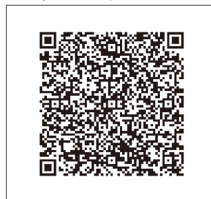
P29 ■ IPCOM EX2 ハードウェアオプション