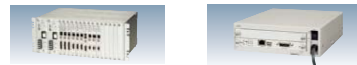
LC-130R (ラックタイプ) -10~55°C 電2 AC・DC LC-110BA (ボックスタイプ(AC)) AC LC-110BD (ボックスタイプ(DC)) DC ※写真はAC電源タイプ -10~55°C