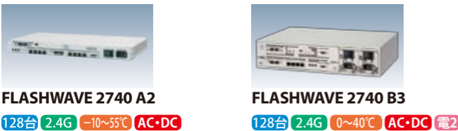
FLASHWAVE 2740 A2 128台 2.4G -10~55°C AC・DC FLASHWAVE 2740 B3 128台 2.4G 0~40°C AC・DC 電2