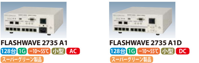
FLASHWAVE 2735 A1 128台 1G -10~55°C 小型 AC スーパーグリーン製品 FLASHWAVE 2735 A1D 128台 1G -10~55°C 小型 DC スーパーグリーン製品

※本製品は、単位性能あたりの消費電力を従来製品と比べて89.6%削減した、富士通の定めるスーパーグリーン製品として認定された製品です。