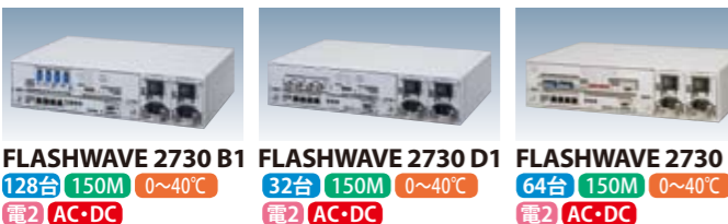
FLASHWAVE 2730 B1 128台 150M 0~40°C 電2 AC・DC FLASHWAVE 2730 D1 32台 150M 0~40°C 電2 AC・DC FLASHWAVE 2730 D2 64台 150M 0~40°C 電2 AC・DC