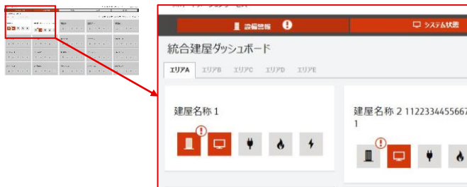
「統合建屋ダッシュボード」