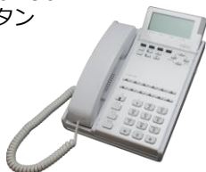
i-station 90A2W 12ボタン