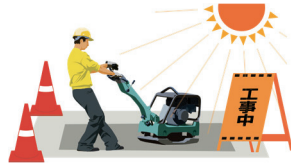
熱ストレス・身体負荷の推定

単純な環境の温湿度によるアラームではなく、作業員それぞれの環境指数や身体の状態を加味した熱ストレス推定を行い、リスクを通知できます。