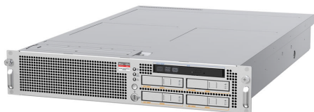
SPARC Enterprise M3000