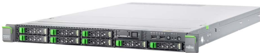
PRIMERGY RX200 S8