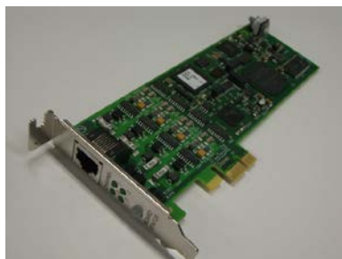
TR1034+ELP4-4L (LowProfile) Analog ボード