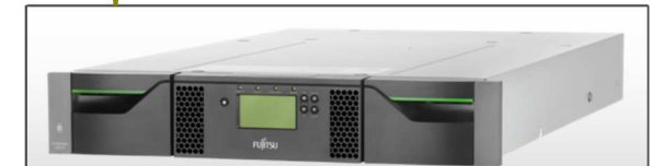
LTOライブラリ ETERNUS LT40 S2