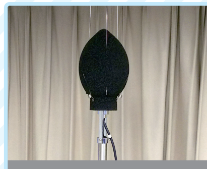
騒音計測 (検定付騒音計使用)