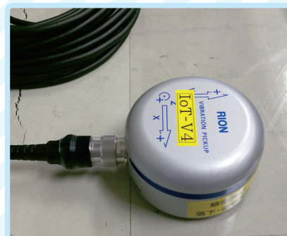
振動計測 (検定付振動計使用)