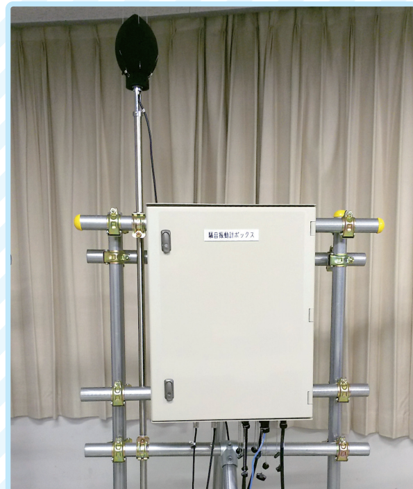
機器収納ボックス