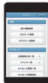
スマートフォン画面