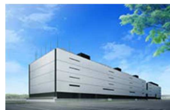
データセンター(館林)

主として法人のお客様向けに、高度な技術と高品質なシステムプラットフォームおよびサービスを機軸として、ICTを活用したビジネスソリューション(ビジネス最適化)をグローバルに提供しています。