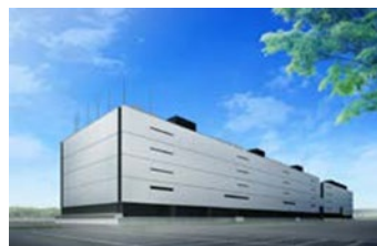
データセンター(館林)

主として法人のお客様向けに、高度な技術と高品質なシステムプラットフォームおよびサービスを機軸として、ICTを活用したビジネスソリューション(ビジネス最適化)をグローバルに提供しています。