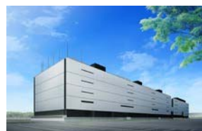
データセンター(館林)

主として法人のお客様向けに、高度な技術と高品質なシステムプラットフォームおよびサービスを機軸として、ICTを活用したビジネスソリューション(ビジネス最適化)をグローバルに提供しています。