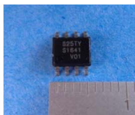
車載向けメモリ 256Kビット FRAM「MB85RS256TY」

デジタル家電や自動車、携帯電話、サーバなどに搭載されるLSIや、半導体パッケージをはじめとする電子部品のほか、電池、リレー、コネクタなどの機構部品を提供しています。