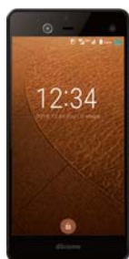
虹彩認証機能を搭載した「ARROWS NX F-01J」

パソコンや携帯電話のほか、オーディオ・ナビゲーション機器などのモバイルウェアの開発、製造、販売などを行っています。