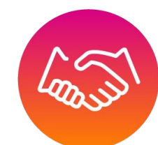
ไม่ใช่ตำแหน่งหน้าที่ เพื่อประโยชน์ส่วนตัว