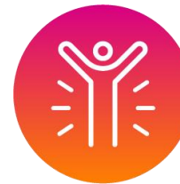
เคารพต่อสิทธิมนุษยชน