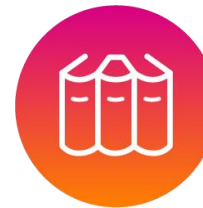
ปกป้องและเคารพ ต่อทรัพย์สินทางปัญญา