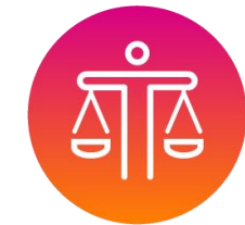
ดำเนินธุรกิจ ด้วยความยุติธรรม