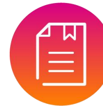
ปฏิบัติตามกฎหมายและข้อบังคับ