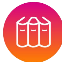
保护并尊重知识产权